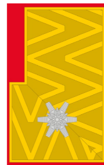
Abschnitts- brand- inspektor